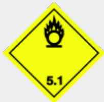
Klasse 5.1 Entzündend (oxidierend) wirkende Stoffe