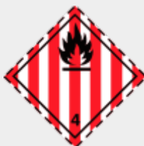
Klasse 4.1: Entzündbare feste Stoffe, selbstzersetzliche Stoffe und desensibilisierte explosive feste Stoffe