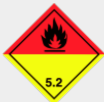
Klasse 5.2 Organische Peroxide