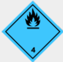
Klasse 4.3 Stoffe, die in Berührung mit Wasser entzündbare Gase entwickeln