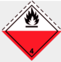
Klasse 4.2 Selbstentzündliche Stoffe