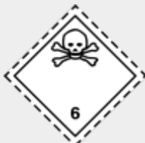
Klasse 6.1 Giftige Stoffe