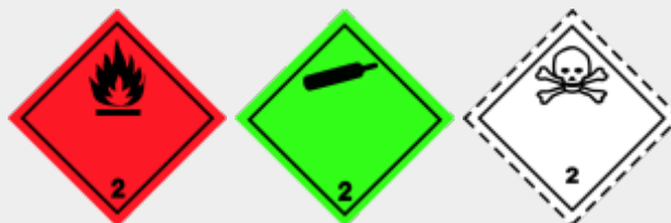
Klasse 2: gasförmige Stoffe