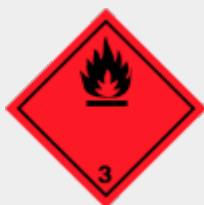
Klasse 3: Entzündbare flüssige Stoffe