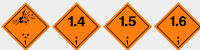
Klasse 1: Explosionsgefährliche Stoffe

Folgende Placards (Großzettel) können nach den ADR-Vorschriften angebracht sein (zu detaillierteren Vorgehenshinweisen zu den einzelnen Klassen siehe CBRN-Einsätze / ABC-Einsätze / GSG-Einsätze ):